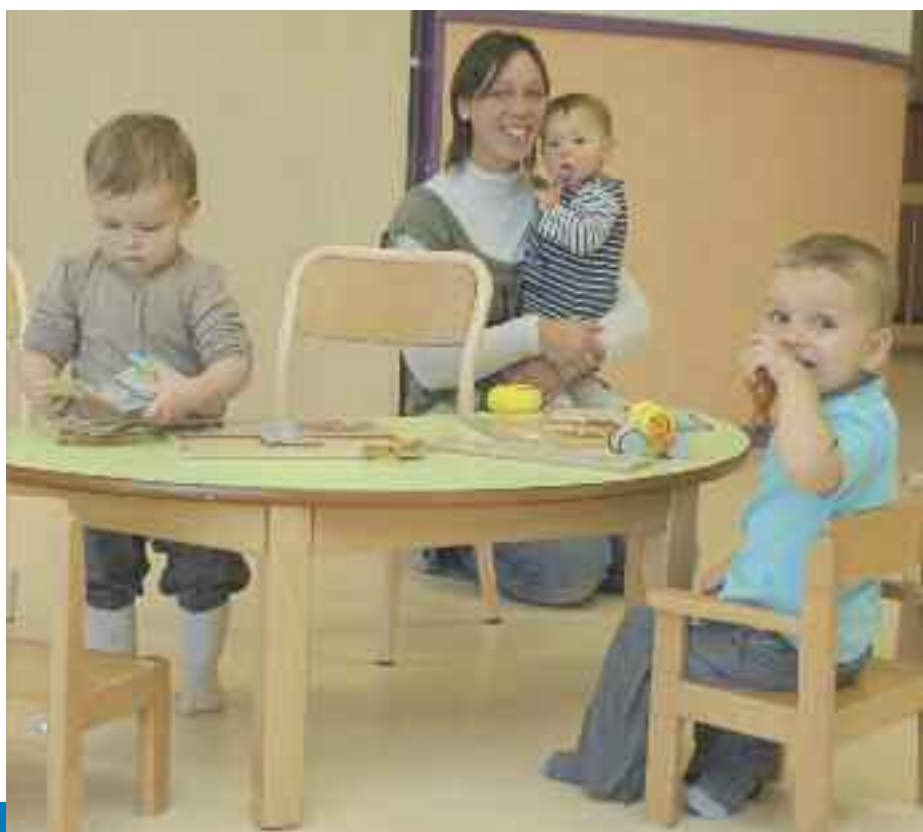
La halte-garderie parentale "Les P'tits Loustics" de Bédée est, à ce jour, la seule structure d'accueil collective des tout-petits sur le canton de Montfort. Elle relève de la compétence de la commune de Bédée.